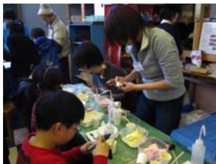
アンモナイトのレプリカづくり