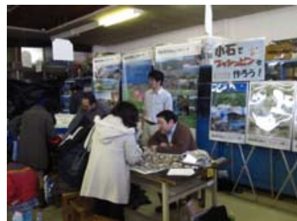
ジオパークポスター