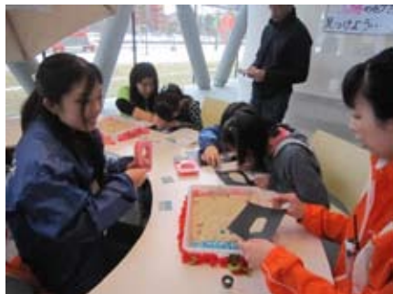
太陽の砂・星の砂