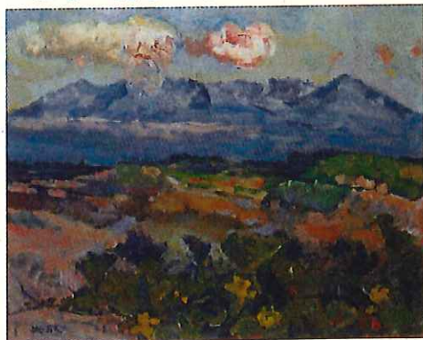
かほちやの花と大雪山 [複製15号] 1972年日動画廊 複製出品行 旭川大学学芸委員