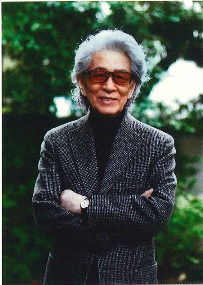
五木 寛之 (いつき ひろゆき)

1932年、福岡県に生まれる。戦後、北朝鮮より引揚げ。早稲田大学文学部ロシア文学科中退。1966年、『さらばモスクワ愚連隊』で小説現代新人賞、『蒼ざめた馬を見よ』で第56回直木賞、『青春の門』で吉川英治文学賞を受ける。2002年度第50回菊池寛賞、2010年、NHK放送文化賞、第64回毎日出版文化賞特別賞を受賞。小説以外にも幅広い批評活動を続ける。代表作に『風に吹かれて』『朱鷺の墓』『戒厳令の夜』『蓮如』『風の王国』『大河の一滴』『TARIKI』『親鸞』(全6巻)などがある。